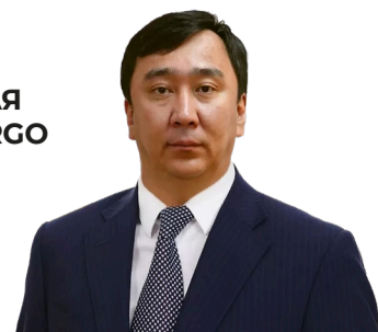
Максат КАЛИАКПАРОВ, вице-министр транспорта

В 2026 ГОДУ ОБЪЕМ ТРАНЗИТА ПЛАНИРУЕТСЯ ДОВЕСТИ ДО 55 МИЛЛИОНОВ ТОНН (+65%). БУДЕТ ЗАВЕРШЕН РЯД КРУПНЫХ ИНФРАСТРУКТУРНЫХ ПРОЕКТОВ. ВЕДЕТСЯ СИНХРОНИЗАЦИЯ ПРИГРАНИЧНОЙ ИНФРАСТРУКТУРЫ С РФ И КНР. УТВЕРЖДЕНЫ ДОРОЖНАЯ КАРТА ҚТЖ И НОВАЯ ТАРИФНАЯ ПОЛИТИКА. В ЧАСТИ ВНЕДРЕНИЯ ИИ-РЕШЕНИЙ ПРОДОЛЖИТСЯ ИНТЕГРАЦИЯ ПЛАТФОРМЫ SMART CARGO С ГОСУДАРСТВЕННЫМИ И ОТРАСЛЕВЫМИ СЕРВИСАМИ. ДО 2027 ГОДА БУДЕТ СОЗДАНА ЕДИНАЯ ИНТЕЛЛЕКТУАЛЬНАЯ ТРАНСПОРТНАЯ СИСТЕМА.